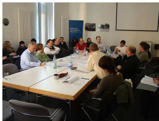
Teilnehmerinnen und Teilnehmer der Workshops im ZZF Potsdam